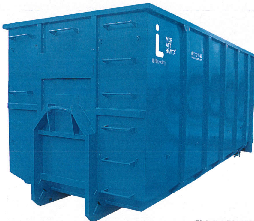
Täckt lastväxlarcontainer 36 m 3